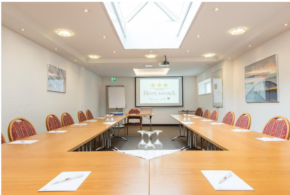
Tagungsraum im AKZENT Hotel Bavaria Oldenburg