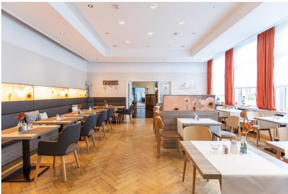
Frühstücksraum des AKZENT Hotel Bavaria Oldenburg